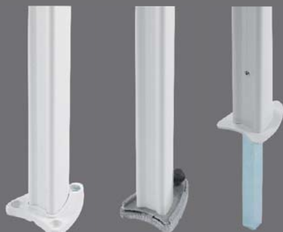
Mast Typ A

Mast Typ C: Dieser Mast ist mit einem Steckschwert ausgestattet, das in die bereits im Boden versenkte Steckhülse (s. Bild) eingeführt und somit befestigt wird.