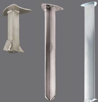
Konsole zum Einbetonieren Erhältlich für Mast Typ A und Typ B